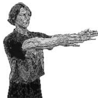
Remise en jeu