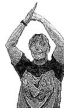
Passage en force