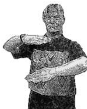
Marcher ou 3 secondes