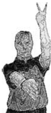
Exclusion (2 minutes)