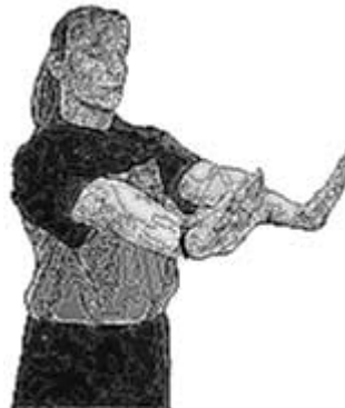
Non respect de la distance des « 3m »